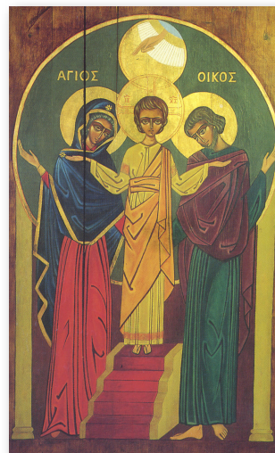
Icône de la Sainte Famille à Lomianki (Pologne)