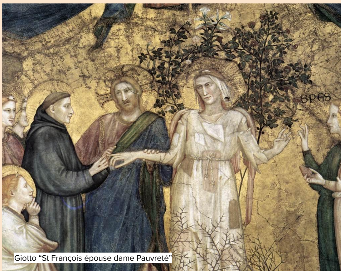
Giotto "St François épouse dame Pauvreté"

Ce saint est connu pour son amour de "dame pauvreté".